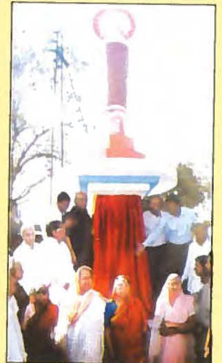
क्रांती चौक (पिंगळवाडे)