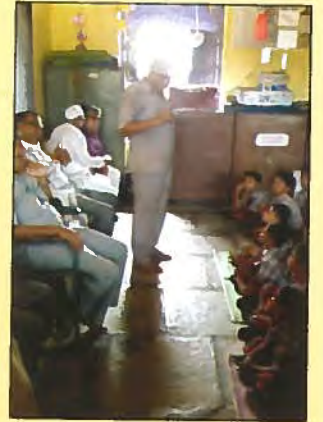
साहित्यिकांनी शाळेला सदिच्छा भेट दिली (पिंगळवाडे)