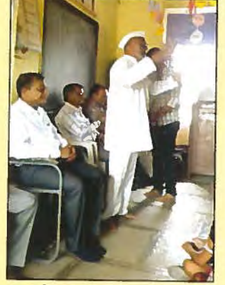
शाहिर श्रावणवाणी मुलांना मार्गदर्शन करताना